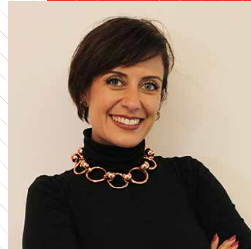
SIL CURIATI Global Creative Agency Lead at Google NY.