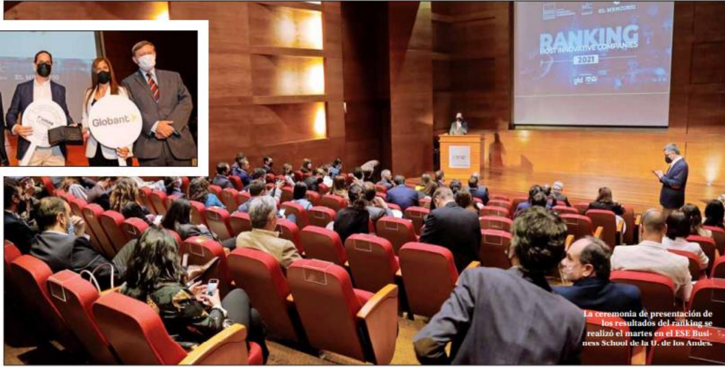
La ceremonia de presentación de los resultados del ranking se realizó el martes en el ESE Business School de la U. de los Andes.

MOST INNOVATIVE COMPANIES, DEL CENTRO DE INNOVACIÓN Y EMPRENDIMIENTO DEL ESE BUSINESS SCHOOL, U. DE LOS ANDES: