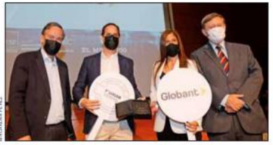
La empresa argentina Globant fue seleccionada como el caso más destacado de MIC 2021 y recibió el Premio "El Mercurio" al Mejor de los Mejores.